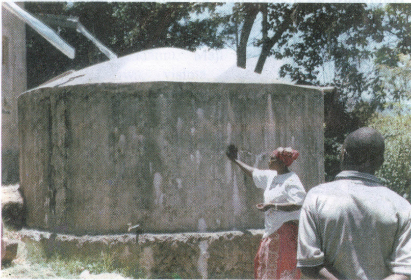
Tangi la maji Katika Kijiji cha Nambala