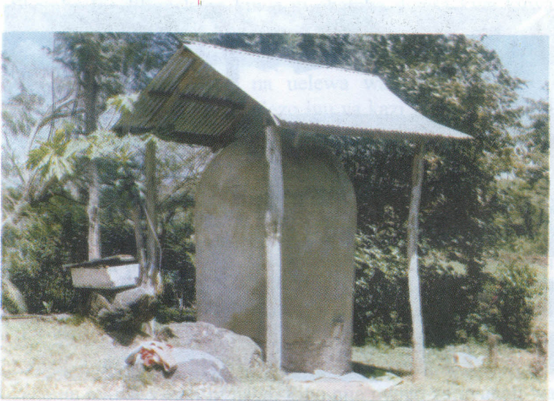
Kihenge Katika Kijiji cha Nambala

Kwa kila mkulima ni muhimu kuhifadhi vizuri mavuno hasa nafaka dhidi ya wadudu waharibifu, wanyama na wezi. Mahindi na mpunga ni baadhi ya mazao yanayolimwa na familia ya Sumari. Wao hutumia vihenge vilivyotengenezwa kwa miti, udongo na samadi kwa kufuata maelekezo ya SCAPA. Vihenge hivyo huweza kuhifadhi nafaka kwa muda wa miaka mitatu hadi mitano, hivyo kumwongezea mkulima uhakika wa chakula kwa muda mrefu zaidi.