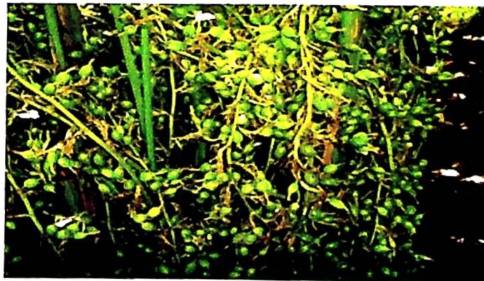
Iliki aina ya Mysore