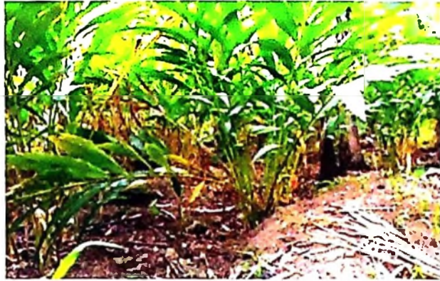
Shamba la iliki lilitotunzwa vizuri