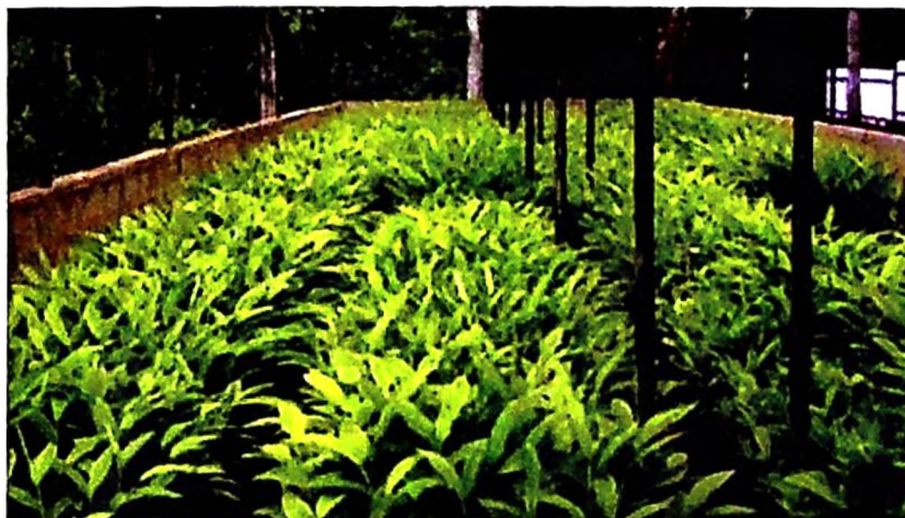
Kitalu cha miche ya iliki